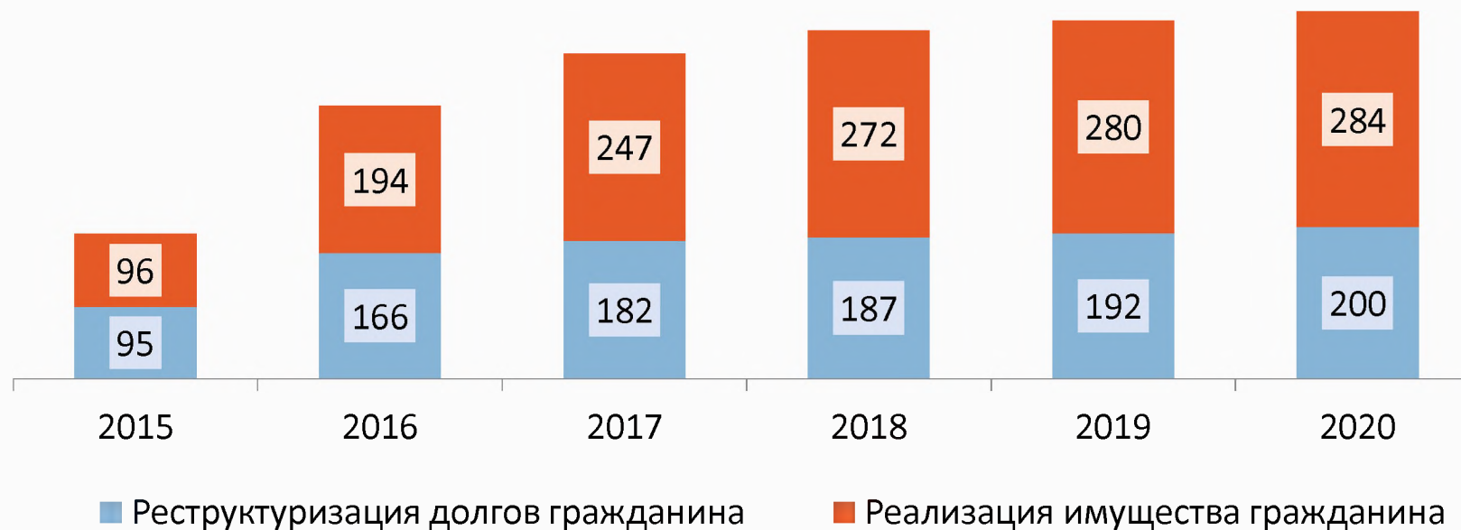
Средняя длительность процедур, дни